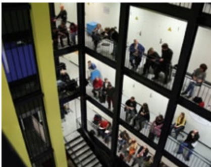
Die Halle des IRB Institutes