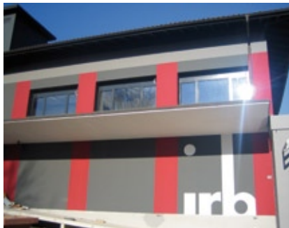
Außenansicht mit IRB Logo

Ein massiver Einsatz diamantbestückter Sägen an den Stahlbetonböden war für die Installation der Autoklaven erforderlich. Zwischenwände wurden hochgezogen, und die Elektro und Sanitärinstallationen sind schon weit fortgeschritten. Die Fassade hat einen neuen Anstrich und ist auch schon mit dem IRB-Logo "verziert".