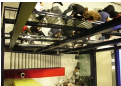
Die Halle des IRB-Institutes

Die Musiker schufen mithilfe der einzigartigen Architektur des Palazzo Fabrizia und eines Mehrkanal-Audiosystems einen dreidimensionalen Klang.